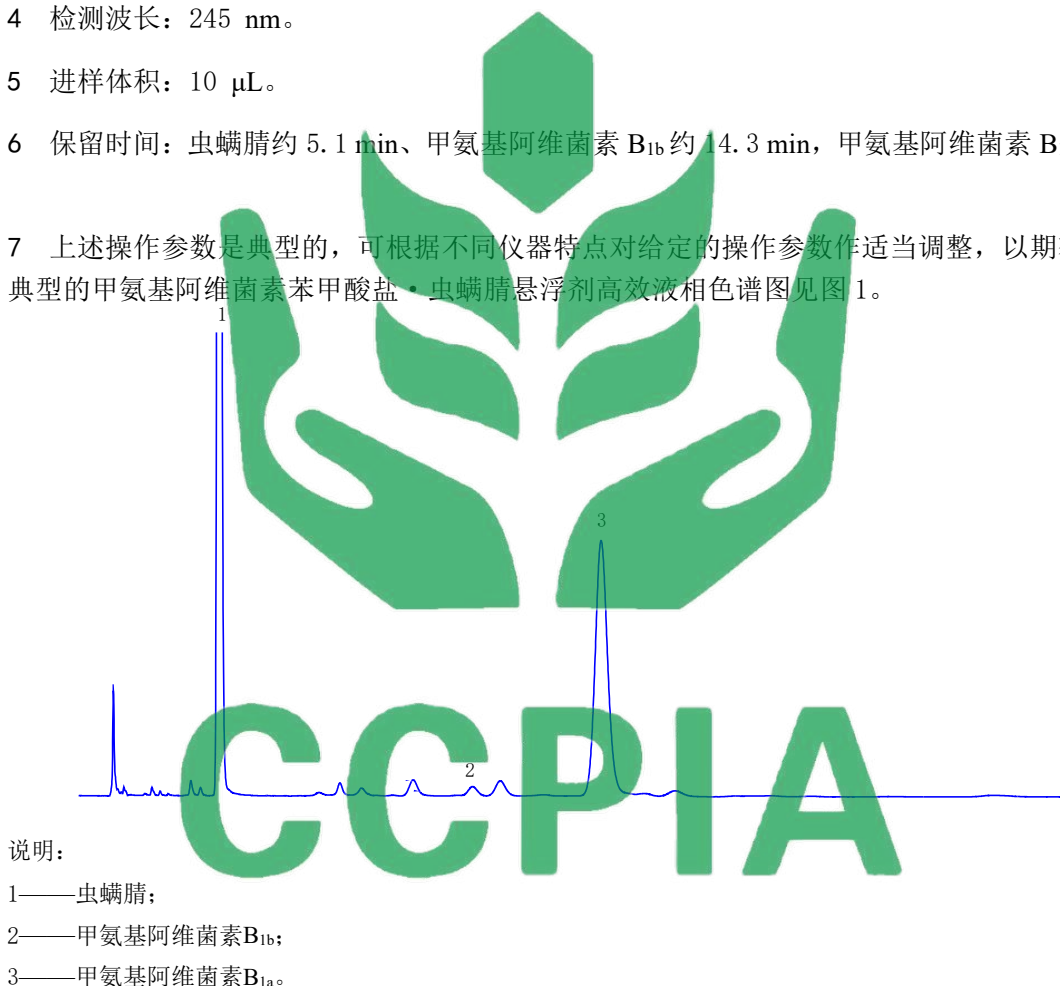
图 1 12%甲氨基阿维菌素苯甲酸盐·虫螨腈悬浮剂中有效成分的高效液相色谱图

5.5.4.7 上述操作参数是典型的，可根据不同仪器特点对给定的操作参数作适当调整，以期获得最佳效果。典型的甲氨基阿维菌素苯甲酸盐·虫螨腈悬浮剂高效液相色谱图见图 1。